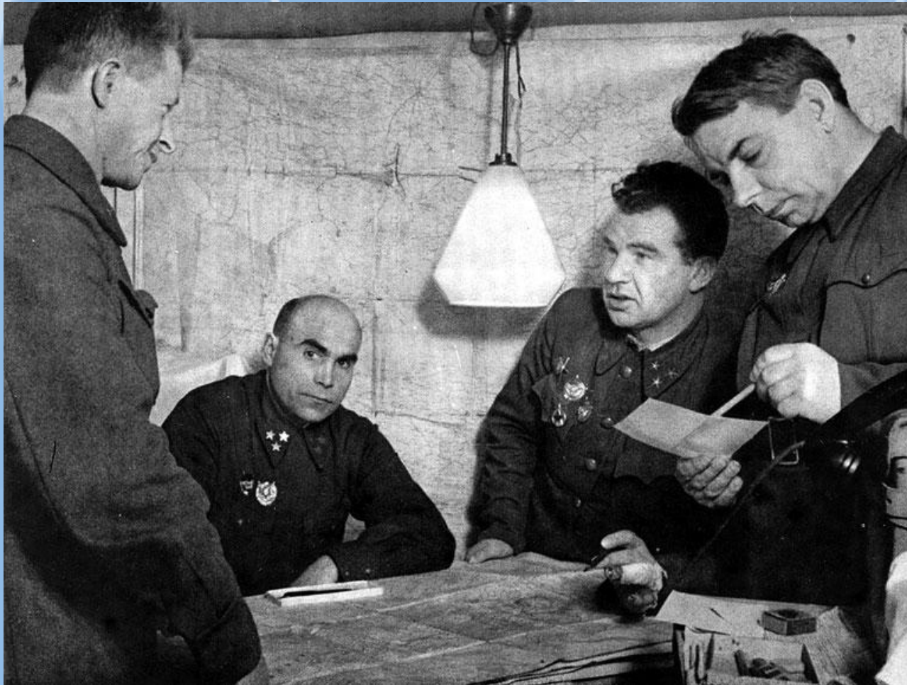
Военный Совет 62-ой армии